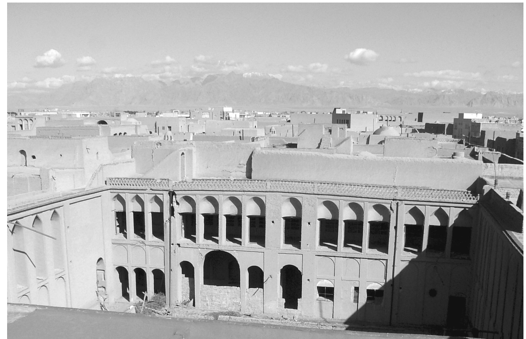
"vue sur la future bibliothèque du Centre Zoroastrien de K. Vafadari de Yazd"

Université de Paris X-Nanterre Bât. F – RdC - Amphithéâtre D